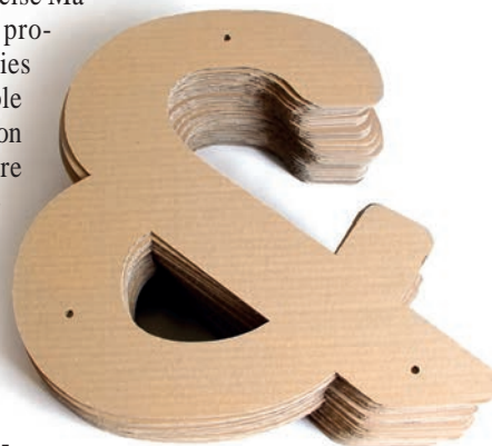
Le mobilier Homycat peut évoluer grâce à ses recharges en carton recyclé.