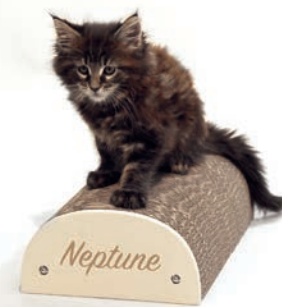
Le griffoir « Homycustom », en forme de demi-cercle, est personnalisable.