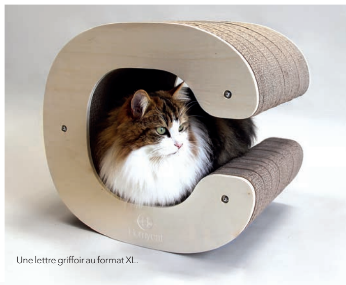
Une lettre griffoir au format XL.

La gamme Homycat propose également des packs composés de deux